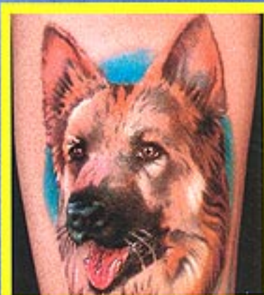
HUNDE & KATZEN